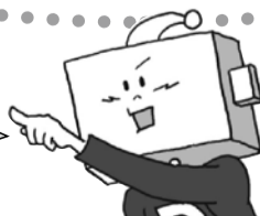
政治マスコット：でんりょくん