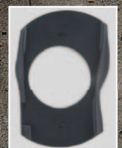
POWER CUSHION ベースパッド

7m の高さから生卵を落としても割らずに跳ね返す POWER CUSHION 採用。衝撃を吸収し、クイックなレスポンスを実現。