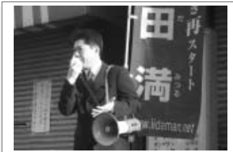
毎朝、欠かすことのない街頭演説、既に4年が経過