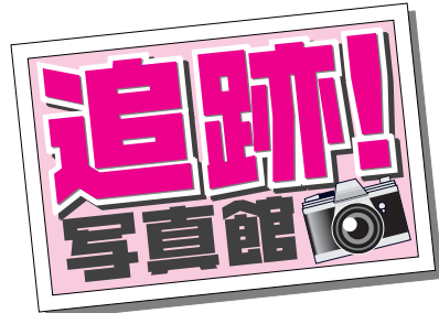
飯田満の活動や行動を“ひと目”で分かりやすくお伝えしています。