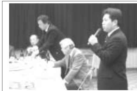
宮前区医師会の会合で川崎市の医療展望について話す