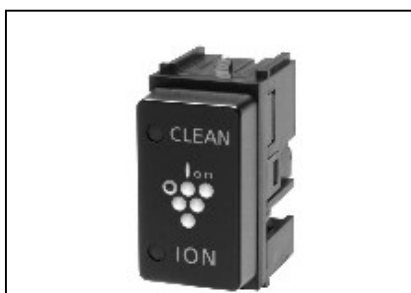
イオン発生モード表示部