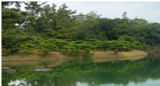
豊かな緑の中で、特に松の緑が美しく、これを映し出す南湖水面との調和が素晴らしい空間となっている栗林公園