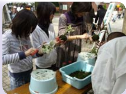
コケ玉づくり や工作などは 子どもたちで にぎわった (洞峰公園)