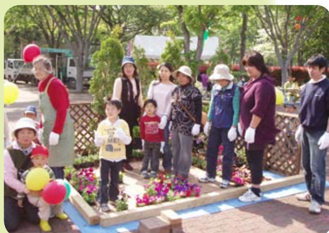
花や緑に関するパンフレットの配布などによる緑化のアピールを実施。花壇づくりの体験などの各種催事には多くの市民が参加した（県西総合公園）