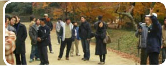
後楽園には広い芝生地が広がるが、明治以前は大半が田畑であり、その名残りで井田として多くのハスが見られる。写真右は視察のもよう

栗林公園は広さ約 23 万坪の広大なもので、寛永年間 (1620)、紫雲山を背景に南湖一体を造園し、さらに寛永の末に讃岐藩主となった松平頼重公 (水戸光圀の兄)、さらに 5 代頼恭公に至る 100 年余にわたり歴代藩主が修築、拡大し、延享 2 年 (1745) に完成。明治維新に至るまでの 228 年間、松平家 11 代の下屋敷として使用された。