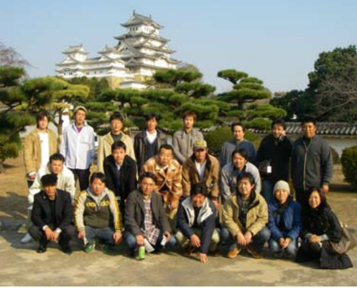
姫路城前での記念撮影（左）と、姫路城西御屋敷跡庭園「好古園」の流れ（好古園は、約3.5haの中村一氏設計監修による日本庭園で、市制百周年を記念し平成4年完成）