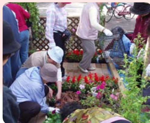
花壇づくりはコミュニケーションの場 としても大活躍（砂沼広域公園）