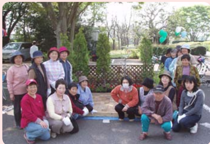
作成した花壇の前で記念撮影（砂沼広域公園）