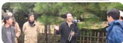
栗林公園の整然とした石組み (左上) 現・商工奨励館の旧藩主「檜御殿」 (右上) 視察のもよう (左)