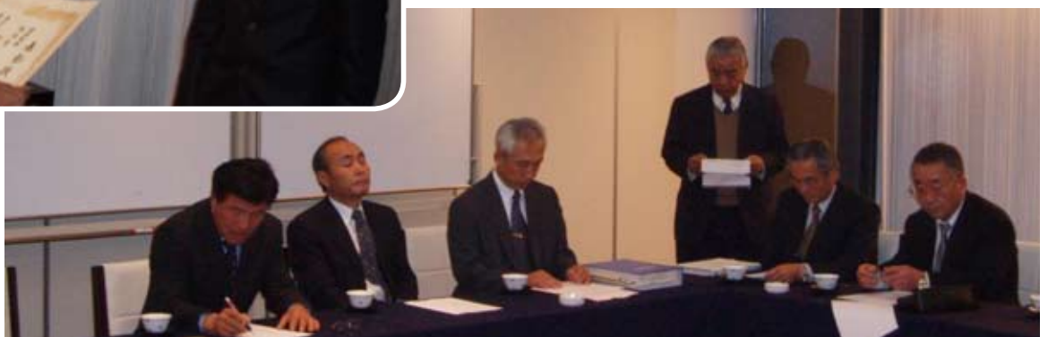
報告会のもよう(下)