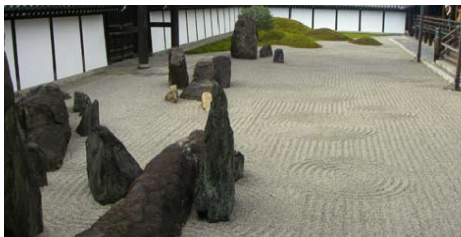
東福寺の南庭（左）は手前が神仙四島、奥に五山の築山を配置。北庭（右上）は、コケと石の市松模様で構成したデザインになっている