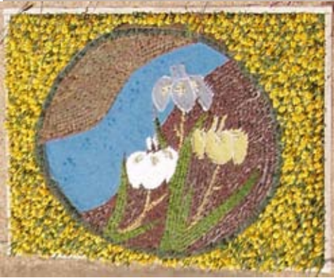
全国自治体花壇「にっぽんの花景色」に茨城県が 出展した花壇は「水郷潮来あやめまつり」をテーマにした鮮やかな花壇で見事「金賞」を受賞した

とした和風庭園空間を出展。さらに、企業・団体出展のぐんまの庭は群馬県内から24庭園が出展され、これらの出展庭園におけるコンテストが実施され、総合部門、都市緑化技術部門、デザイン部門、施工部門の各部門ごとに金・銀・銅賞が選ばれ、茨造協出展庭園は、デザイン部門の銀賞を受賞した。