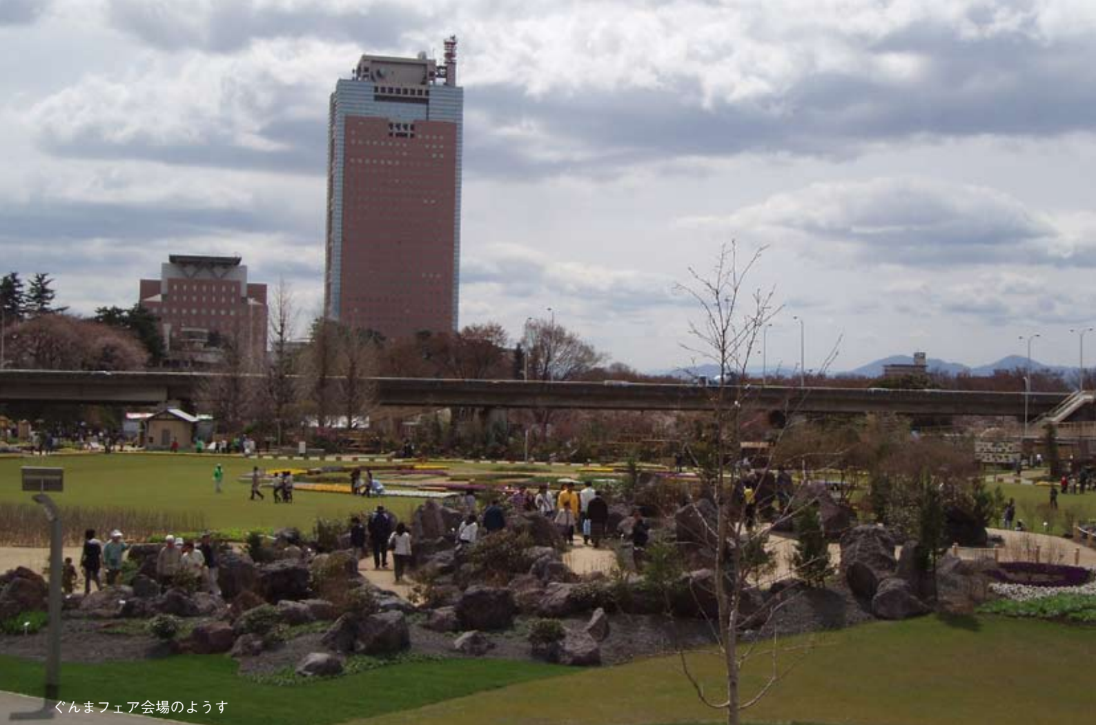
ぐんまフェア会場のようす