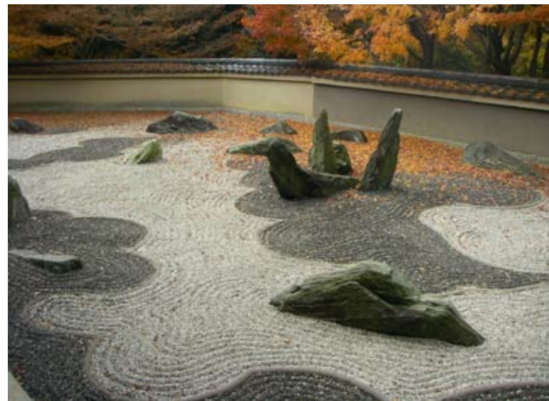
龍吟庵の白砂（海波）と黒砂（雲紋）を地模様とした異相の庭で、龍が海中から昇天する姿を象徴化した方丈南庭

光明院の波心庭は三尊石組みが配され、本堂と書院のどちらからも美しい姿を鑑賞できるように設計されている