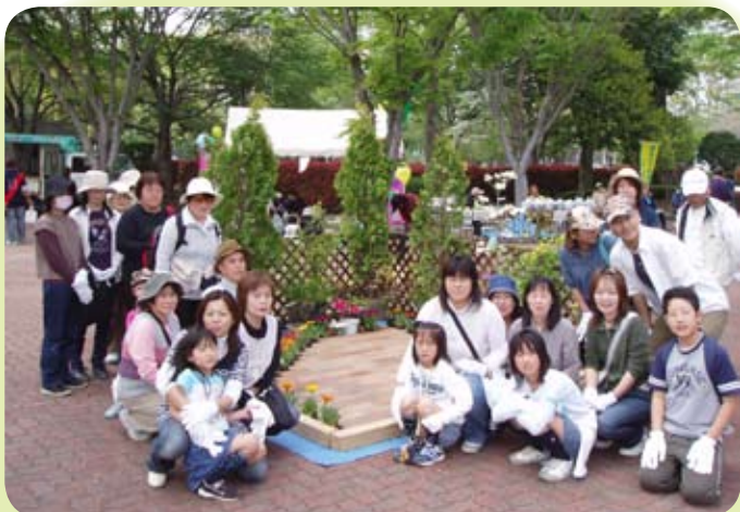
作成した花壇の前で記念撮影（県西総合公園）

平成 20 年度春季都市緑化祭が、ひたち海浜公園、県西総合公園、砂沼広域公園、港公園、偕楽園公園、笠間芸術の森公園、大子広域公園、鹿島灘海浜公園で開催され、都市緑化の大切さを楽しみながら感じられる