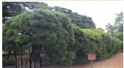
藩政時代に植えられた讃岐の黒松は、長年にわたる手法管理され、その姿が箱の形をしていることから「箱松」と呼ばれており、栗林公園独自の樹形となっている (写真一番下)