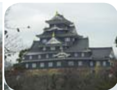
岡山城の北側に広がる後楽園は、かつて上流から水を引き、池や滝に利用し、曲水は再び川に戻る設計で、大半を田畑だった。写真右下は巨石を90数個に割って組み戻した「大立石」