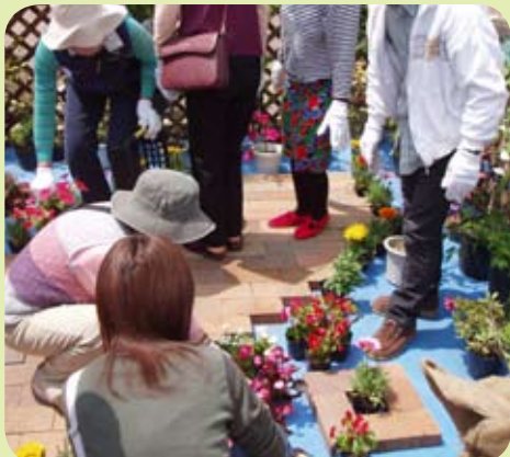
竹細工や寄せ植づくりにも多くの方々が集まり、花と緑に触れあった（県西総合公園）