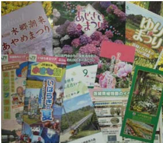
茨城の観光をPRする各種パンフレット

今年度の『ひばり』の表紙は、茨城百景と題して、茨城を代表する素晴らしい風景が紹介され、その第