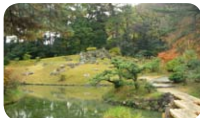
栗林公園の水辺風景 (写真右の中央億は「小普陀」と呼ばれ、園内の他の場所の石組みとは異なる室町時代 (1400 年頃) の技法が見られ、栗林公園発祥の地とされている)