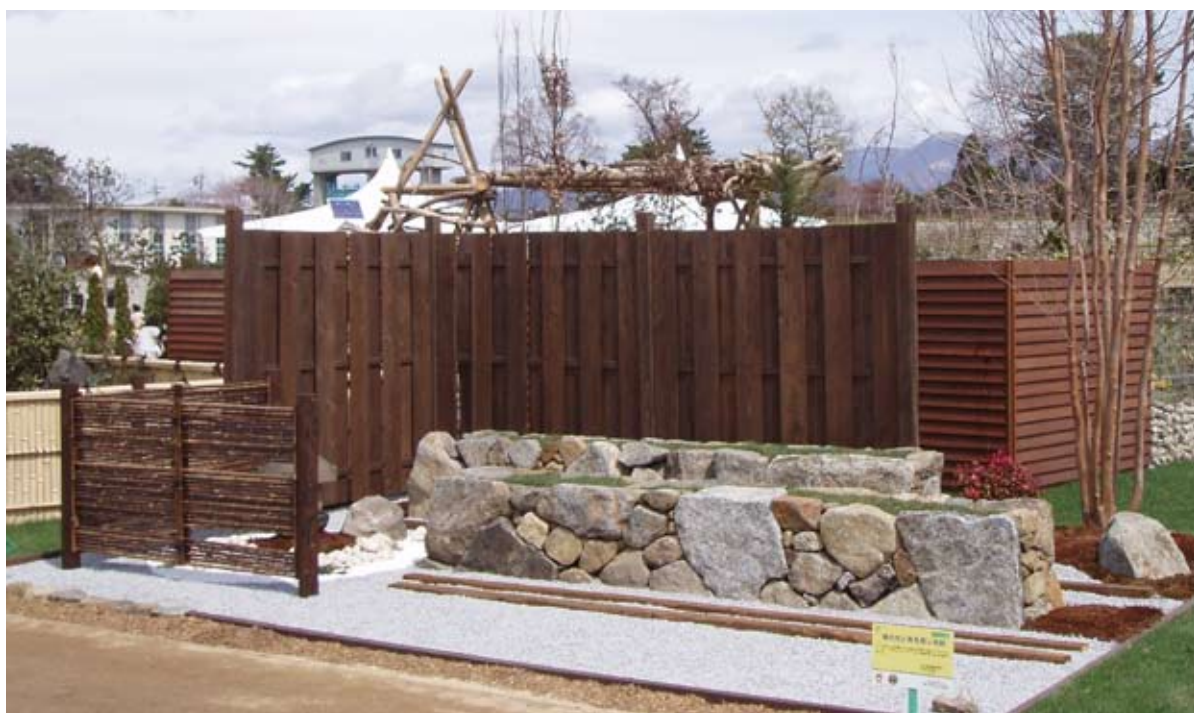
茨造協が出展した「陽の光と風を感じる庭」はデザイン部門銀賞を受賞

今年3月29日から6月8日まで、群馬県の前橋公園と敷島公園、城址公園周辺市街地の高崎会場などを中心に開かれた第25回全国都市緑化ぐんまフェアは、72日間の会期中、目標の100万人を大きく上回る142万3000人が来場し大盛況。広く都市緑化をアピールした。