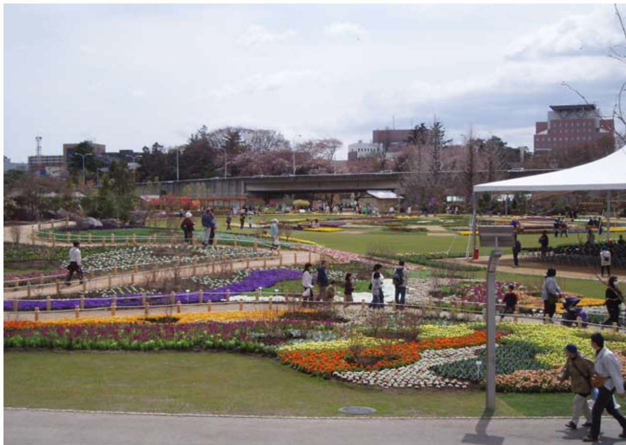
6月8日に閉幕した第25回全国都市緑化ぐんまフェアには会期中142万人が訪れ賑わった