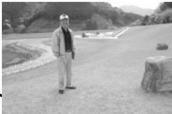
公園内のほとんどが芝で覆われています。

特にPRはしていませんが、知っていると思います。我々が作業しているところに、町の人が遊びに来るでしょう？顔見知りの人が多いですから、我々の顔を見れば業者さんじゃないんだってわかてもらえますよ。