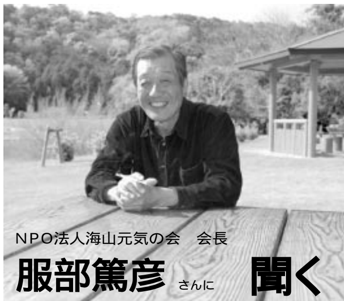
NPO法人海山元気の会 会長

健康にもいいし、おしゃべりしたり、弁当をゆっくり食べたりね、楽しみですよ。私たちの会の目的の一番最初には「高齢者の健康維