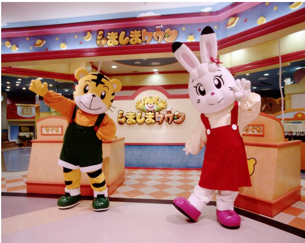
【「しましまタウン」に登場する「しまじろう」(左)と「みみりん」(右)】 写真は「しましまタウン船橋店」

「しまじろう」とその仲間が活躍するTVアニメ番組「しましまとらのしまじろう」は、全国34局で放映中であり、1993年の放送スタート以来、就学前の幼児を中心に人気の長寿番組となっています。