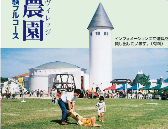
インフォメーションにて遊具を 貸し出しています。(有料)