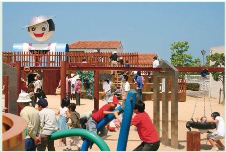
子どものおアシス