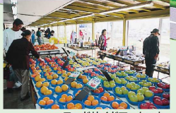
ロードサイドマーケット