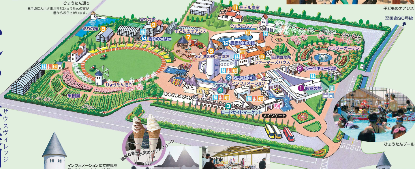
ひょうたんプール