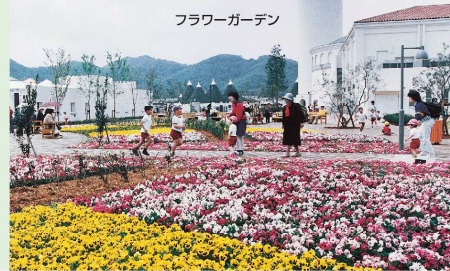
フラワーガーデン