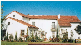
モデル農家 1棟につき 6名まで 宿泊できます。