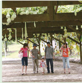
ひょうたん通り 8月頃に大きさまざまなひょうたんの実が 棚からぶさがります。