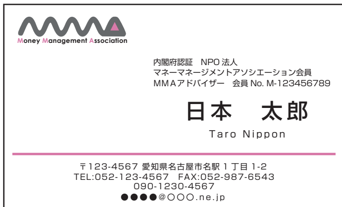
(1) アドバイザー住所