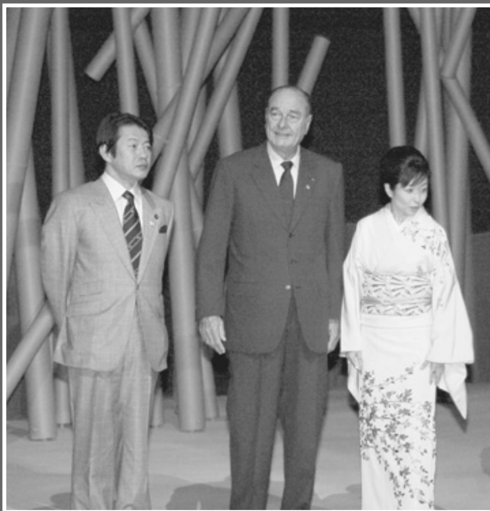
愛・地球博 竹下景子日本館総館長と共にシラク大統領をご案内