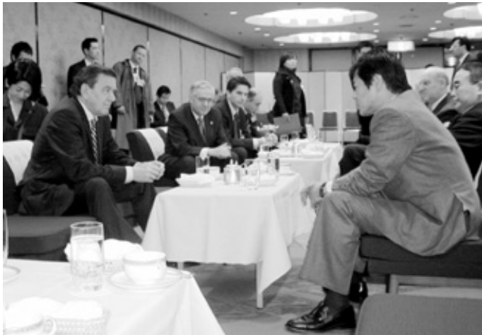
ドイツ・シュレーダー首相と会談 (2004.12.9 ホテルオークラにて)