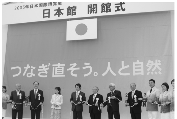
(2005.3.13 日本館 開会式)