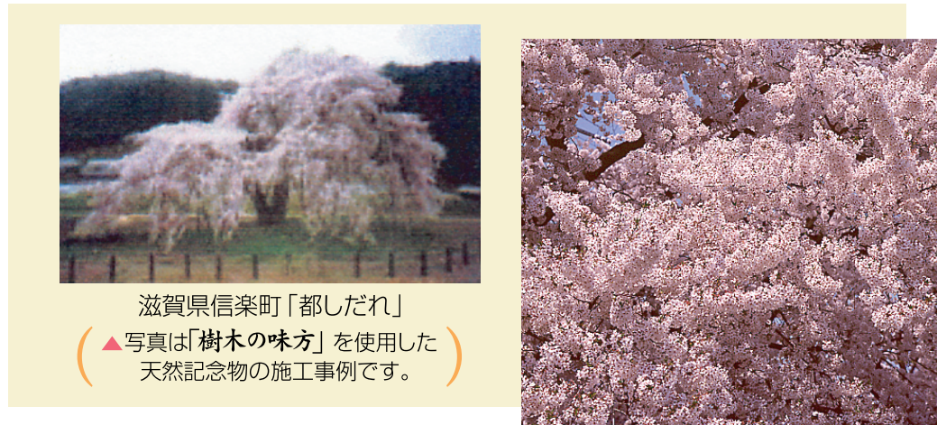
滋賀県信楽町「都しだれ」