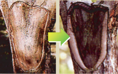
塗布2ヶ月後から18ヶ月後の変化