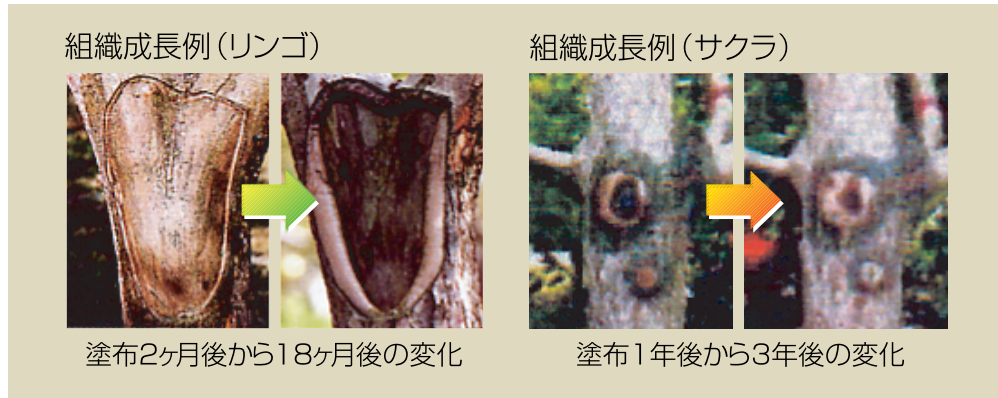
組織成長例 (リンゴ)