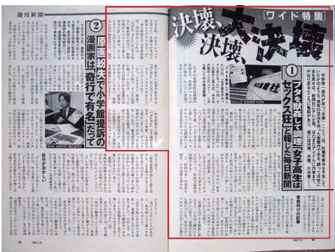
週刊新潮7月3日号(6月26日発売) 枠線で囲んだ部分

「B 級メディアの類ではない。日本を代表する新聞のひとつ、であるはずの毎日新聞の英字ウェブサイトで、極端に歪められた日本文化が、事実であるかのごとく世界に配信されていた。」（週刊ポスト 2008.7.11 号の 54 ページ冒頭より引用）