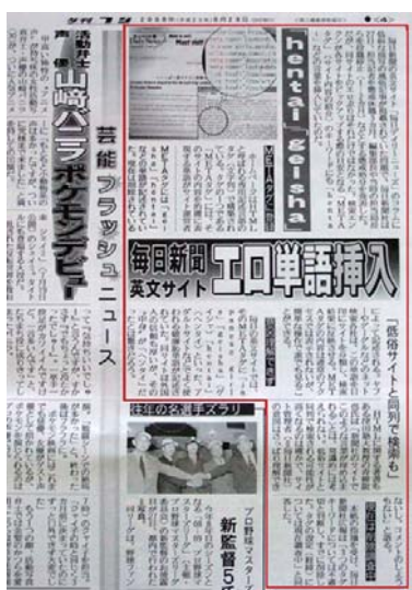
タ刊フジ(6月29日発売) 枠線内

国内で広く知られ始めたのは6月20日。記事が卑猥すぎ、テレビ報道の可能性は低いですが、印刷メディアが取り上げ始めました。毎日新聞社は25日朝刊にて謝罪文を掲載。しかし、上に列挙した内容は、日本の社会や風俗の一端を紹介したものと主張。同日、担当部署の常務は取締役社長に昇進しました。