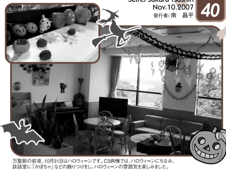
万葉節の前夜、10月31日はハロウィンです。C3病棟では、ハロウィンにちなみ、談話室に「かぼちゃ」などの飾りつけをし、ハロウィンの雰囲気を楽しみました。

Seirei Sakura Tsushin vol. 40 Nov. 10, 2007 発行者/南 昌平