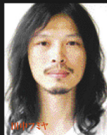
FUMIYA TANAKA fumiyanataka.com

1989年にビエール瀧らと「電気グルーヴ」を結成。1995年には初のソロアルバム「DOVE LOVES DUB」をリリース。この頃から本格的にDJとしての活動もスタートする。1998年にはベルリンで行われる世界最大のテクノ・フェスティバル「Love Parade」のFinal Gatheringで150万人の前でプレイするという偉業を成し遂げる。1999年からは1万人以上を集める日本最大の大型屋内レヴ「WIRE」を主催し、積極的に海外のDJ/アーティストを日本に紹介している。