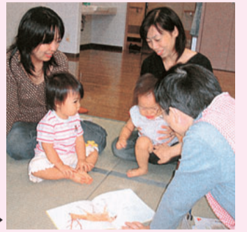
楽しく子育て交流▶