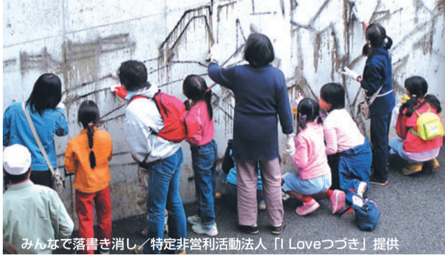
みんなで落書き消し

都筑区内では、公共の壁、駅前広場や公園などに落書きされることが多く、NPO、町内会、商業振興会やハマロードサポーターの皆さんにボランティア活動として、自主的に落書き消しを行っていただいています。その際、土木事務所では薬剤等の提供(支援)を行っています。薬剤等の提供をご希望の場合は、土木事務所にご連絡ください。落書きを地域の皆さんの力で一掃しましょう。 ☎都筑土木事務所 ☎942-0606 ☎942-0809