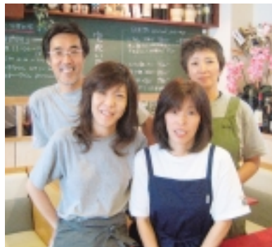
▲イタリアトスカーナ地方のキャンティワインもおすすめ。